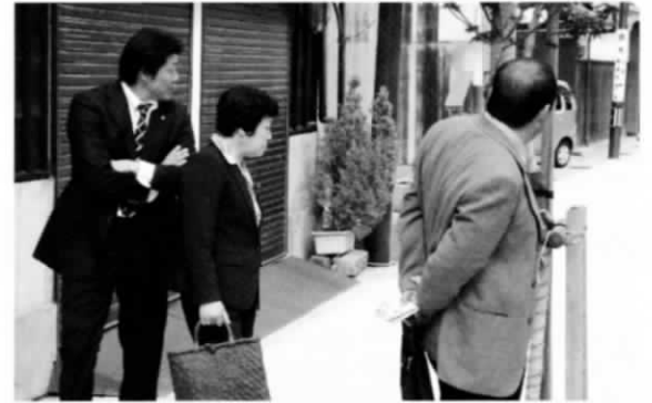
20年5月 産業文教委員会視察 岐阜市のまちづくり戦略を研修