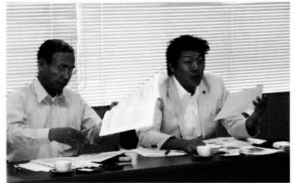
20年7月 長野市役所にて 大河ドラマと併せた観光誘客戦略を研修