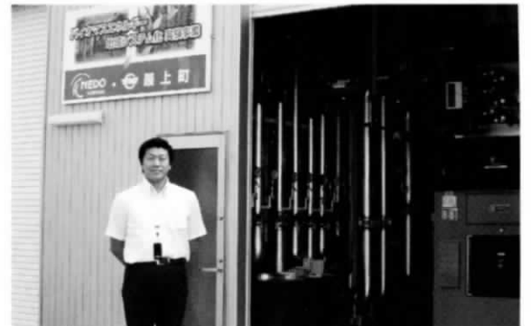
20年7月 森・林・産業活性化推進議連研修で最上町へ 間伐材等を活用し木質バイオマスチップによるエネルギー変換 を研修